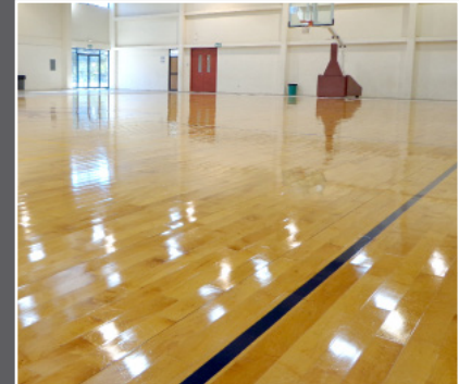
MANTENIMIENTO Y REPARACIÓN DE DUELAS.

Limpieza Vejar - Concretec, Grupo líder en la Producción y Comercialización de Productos Químicos, Accesorios, Equipos y Servicios para el Desbastado, Pulido, Entintado, Oxidado y Mantenimiento de Pisos de Concreto, y Duelas; manejando nuestra marca propia, y siendo distribuidores exclusivos de las fibras especializadas Treleoni, y Equipos Pioneer Eclipse.