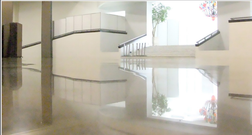
DESBASTADO, PULIDO, ABRILLANTADO, ENTINTADO, OXIDADO Y MANTENIMIENTO DE PISOS DE CONCRETO.